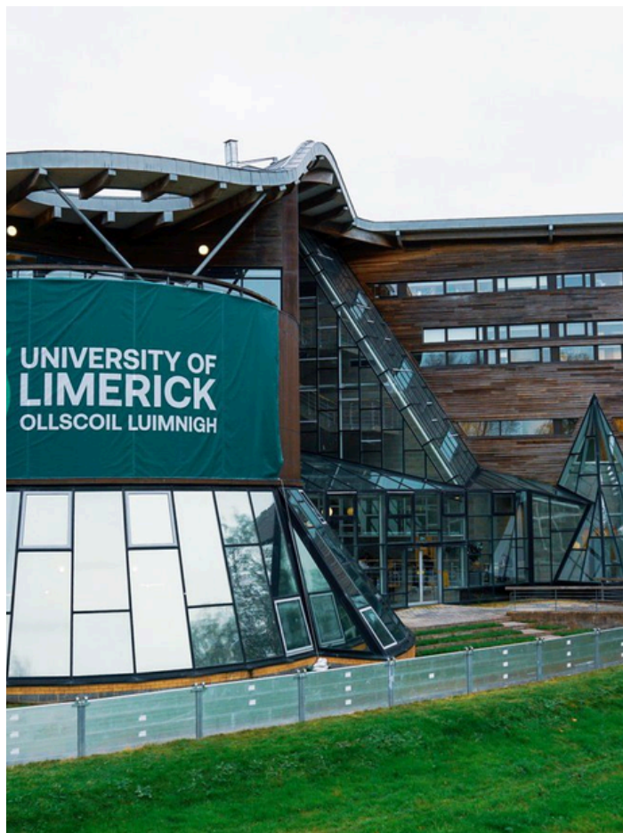
Crédito: Masters Ireland